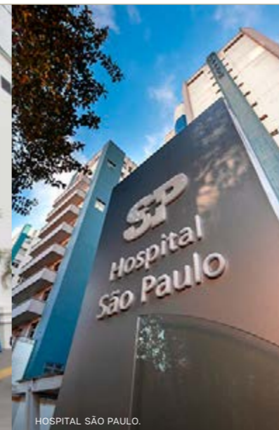
HOSPITAL SÃO PAULO.