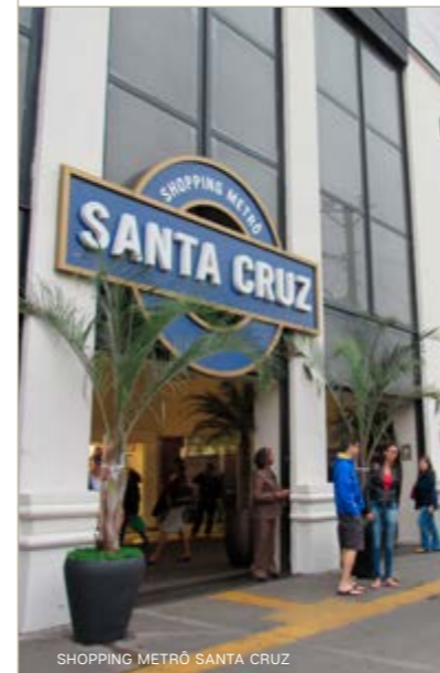
SHOPPING METRÔ SANTA CRUZ