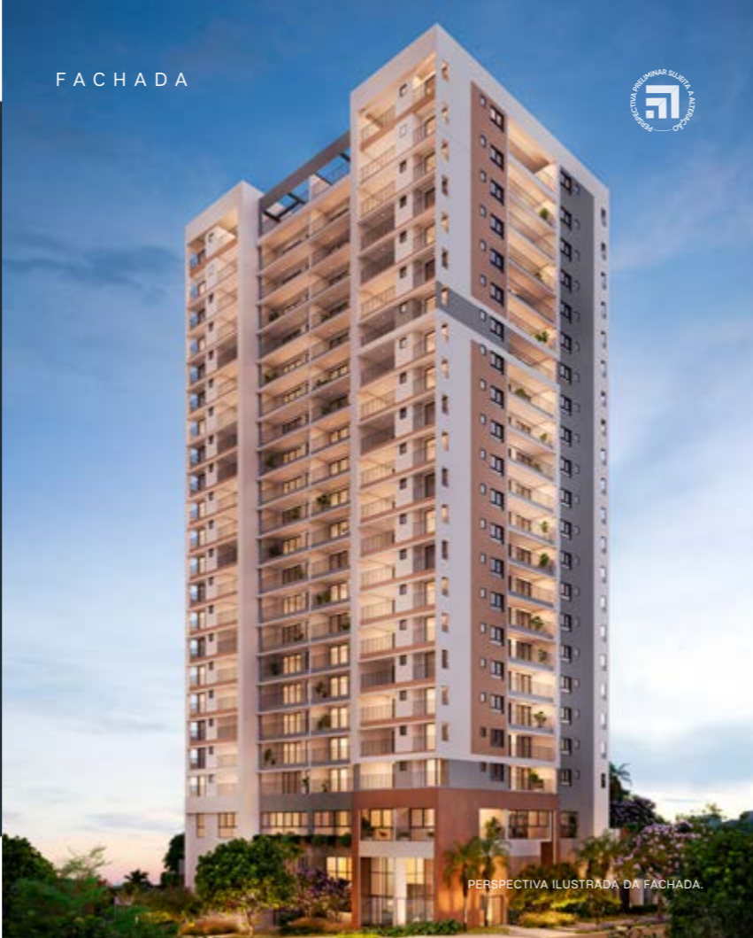
PERSPECTIVA ILUSTRADA DA FACHADA.