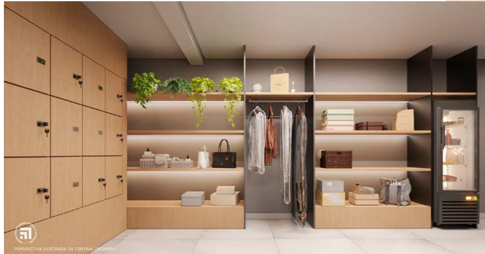
PERSPECTIVA ILUSTRADA DA CENTRAL DELIVERY.